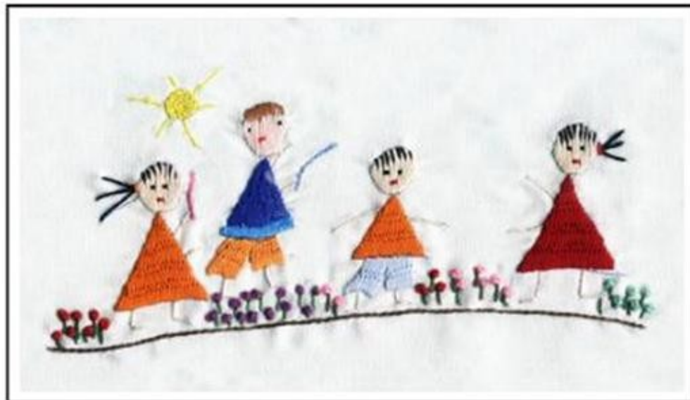
Brincadeiras de Salão